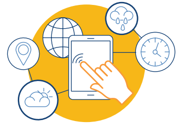
Localización de contenido