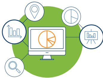
Optimización de análisis