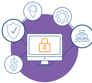
Prevención del fraude en Internet