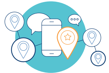
Localización de usuarios móviles